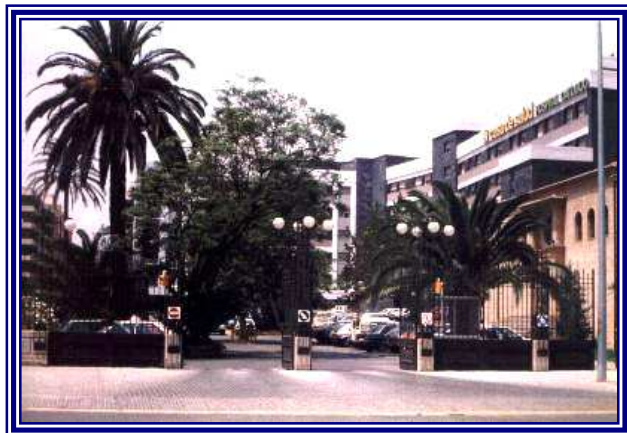
Hospital Casa de Salud (2001)